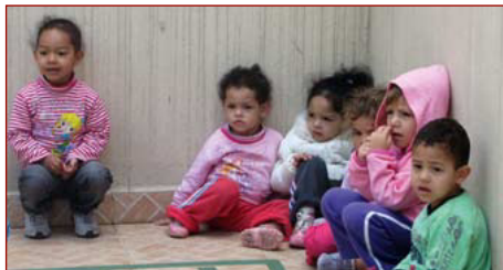
Kinderhort St. Clara

Jeder hat als Mitglied der Gesellschaft das Recht auf soziale Sicherheit und Anspruch darauf, durch innerstaatliche Maßnahmen und internationale Zusammenarbeit sowie unter Berücksichtigung der Organisation und der Mittel jedes Staates in den Genuss der wirtschaftlichen, sozialen und kulturellen Rechte zu gelangen, die für seine Würde und die freie Entwicklung seiner Persönlichkeit unentbehrlich sind.