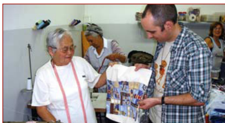
Besuch in der Seniorenschneiderei