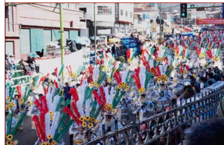
Festzug Jesus del Gran Poder