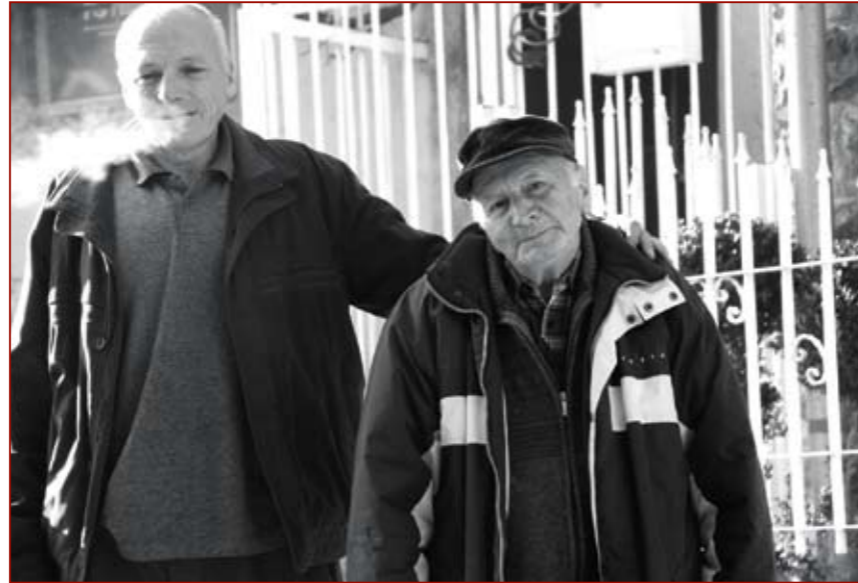
Im Kleinen funktioniert, was im Großen noch immer ein Traum ist: sichtbarer Frieden. Ein Serbe und ein Moslem in tiefer Freundschaft verbunden

Am Berghang gegenüber haben sich zur selben Zeit orthodoxe Serben vor ihrer Kirche versammelt. Gut sichtbar stehen rechts und links der Kirche große Lautsprecherboxen. Nur einen Steinwurf weiter ertönt der Ruf zum Mittagsgebet vom Minarett der Moschee. Es dauert kaum zehn Sekunden, bis die Lautsprecher alles im Tal mit serbischen Volksliedern übertönen. Die Texte handeln vom Kriegsverbrechertribunal in Den Haag und dass »der serbische Held Ratko Mladić« dort nicht hingehöre. Das ist Verherrlichung des Genozids und in Srebrenica nicht selten. Zwischen Kirche und Moschee trifft plötzlich die Polizei ein. Der Chef des Motels