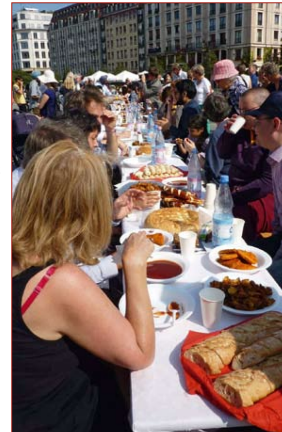
300 Muslime, Christen, Sikhs und Angehörige vieler anderer Religionen aßen, tranken und redeten miteinander bei der Eröffnung der Langen Nacht der Religionen auf dem Gendarmenmarkt in Berlin.