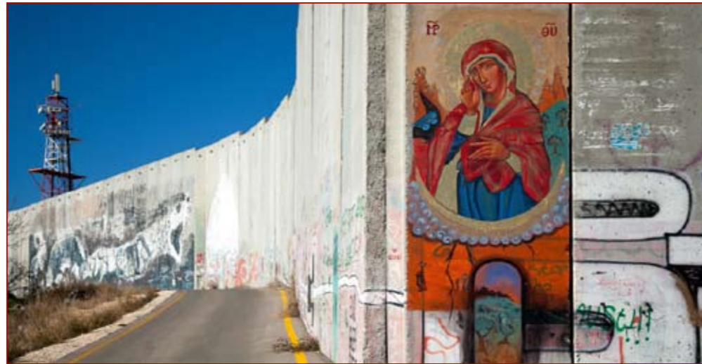
Christen haben eine Marienikone an die Mauer in Bethlehem gemalt – in der Hoffnung auf Frieden.

Das Leid für die Menschen in Israel sowie im Gazastreifen und im Westjordanland wird immer größer. Die Sehnsucht nach Frieden bleibt, besonders für die Menschen im leidgeplagten Heiligen Land, trotz so vieler Kriege.