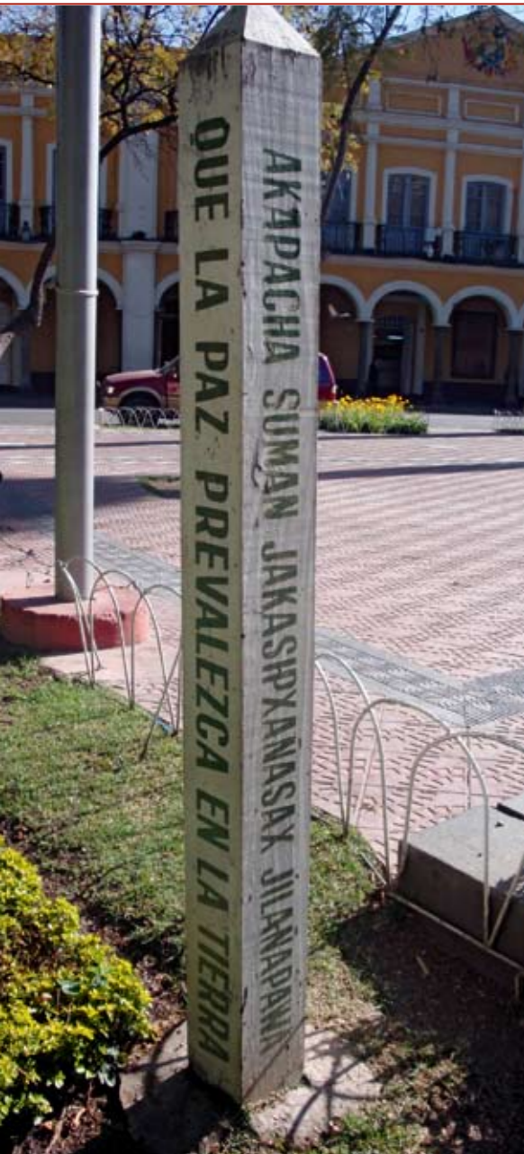
Friedenspfosten des weltweiten Peace Pole -Projektes

Den Frieden zu fördern ist nach dem Vorbild von Franziskus und Klara ein wesentliches Element unseres Charismas. Instrument des Friedens zu sein, ist deshalb auch das Hauptziel der franziskanischen Bewegung für Gerechtigkeit und Frieden in Bolivien.