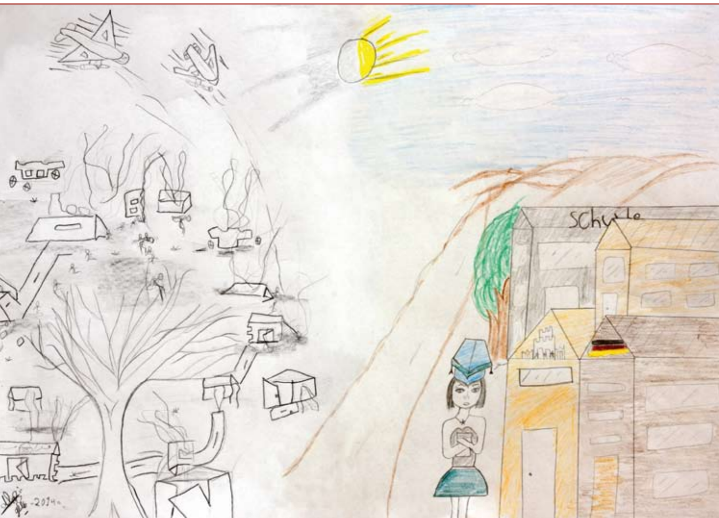
Die syrische Tochter verarbeitet in Zeichnungen die traumatischen Erlebnisse ihrer Flucht.