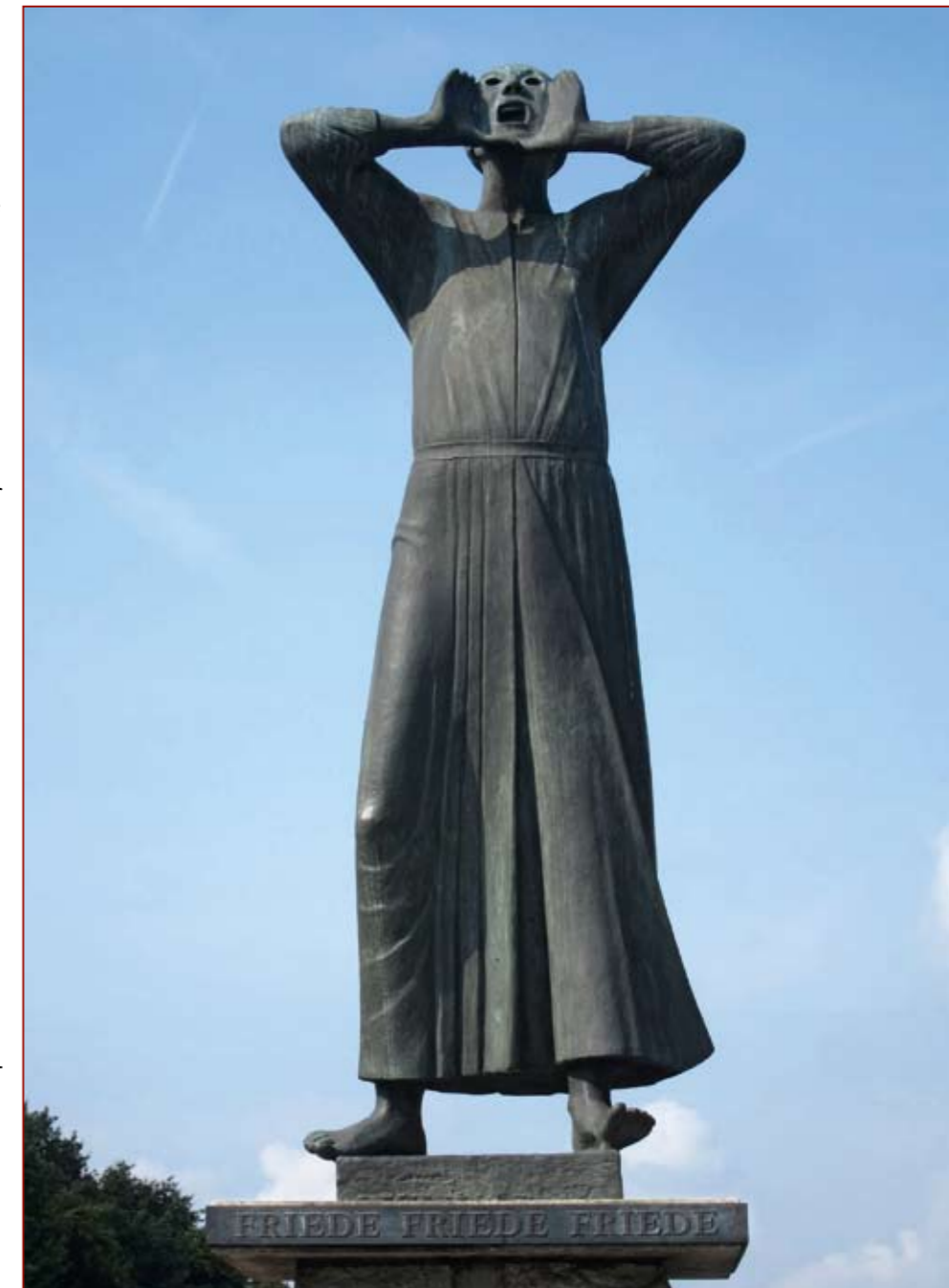
Der Rufer von Gerhard Marcks steht auf dem Mittelstreifen der Straße des 17. Juni in Berlin.