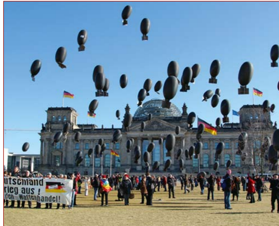
Ballonaktion vor dem Reichstag in Berlin

Jede Minute stirbt ein Mensch an einer Landmine, einer Gewehrkugel oder einer Handgranate. Allein durch Gewehre und Pistolen der deutschen Waffenschmiede Heckler & Koch GmbH haben laut Schätzungen von Fachleuten seit Ende des Zweiten Weltkrieges weit mehr als eine Million Menschen ihr Leben verloren. Ungezählte Menschen sind durch die vielen anderen Waffen exportierenden deutschen Unternehmen ums Leben gekommen. Zu den Empfängern deutscher Waffen, Rüstungsgüter und Lizenzen zählen viele Diktaturen, die die Menschenrechte mit Füßen treten.