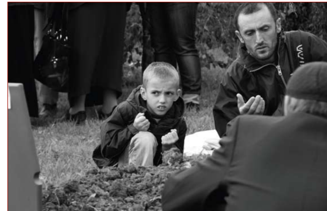
19 Jahre nach dem Massaker werden noch immer Überreste der Opfer gefunden und begraben. Das Unfassbare ist greifbar nah.