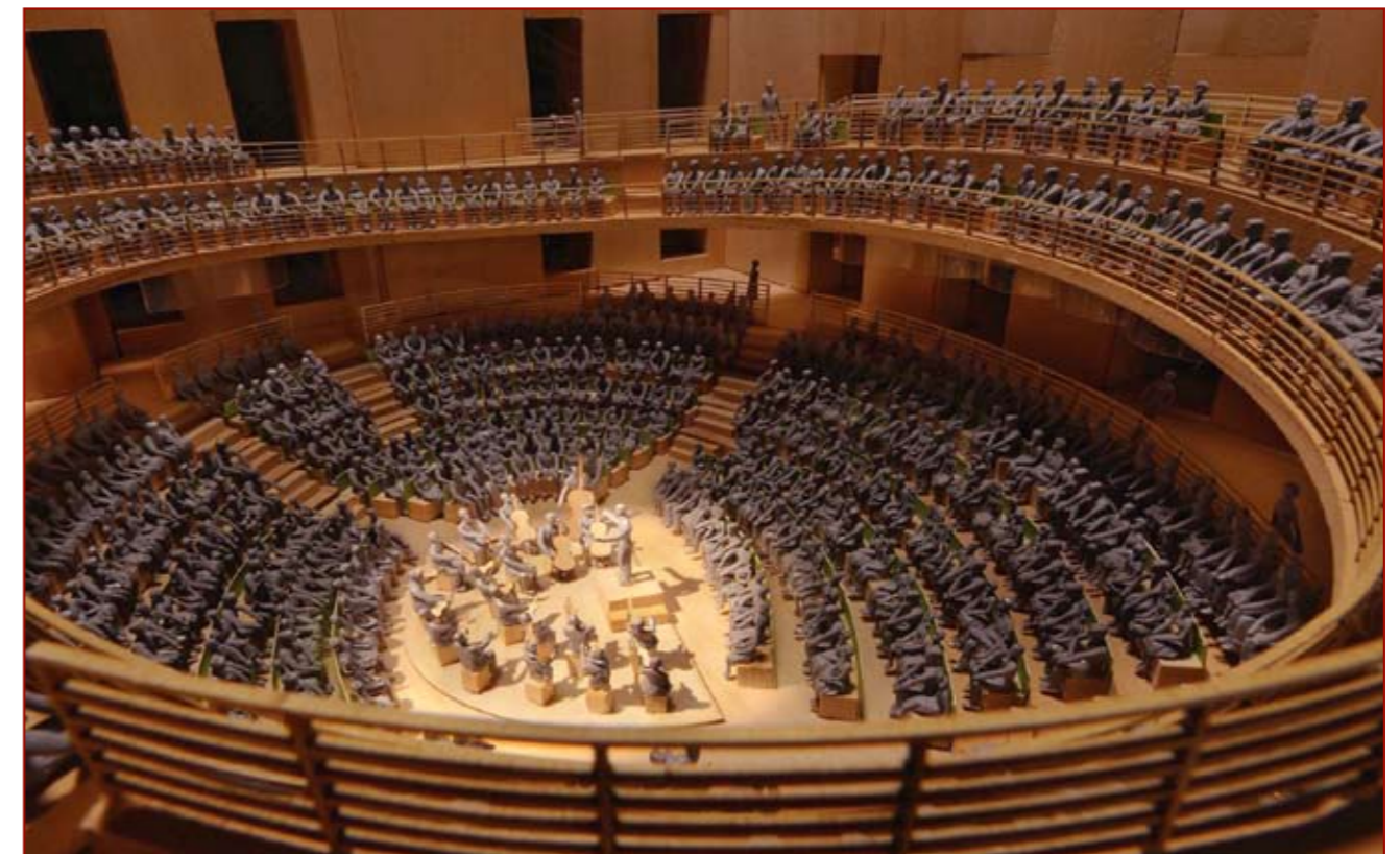
Modell des Konzertsaals