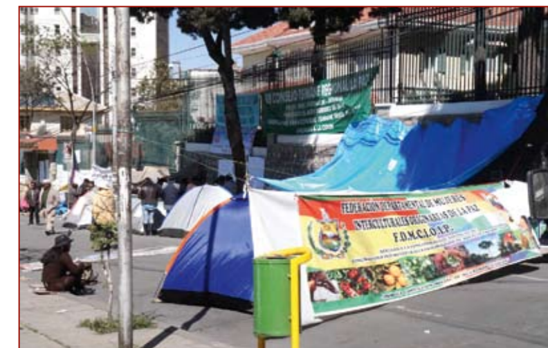
Straßenblockaden in La Paz