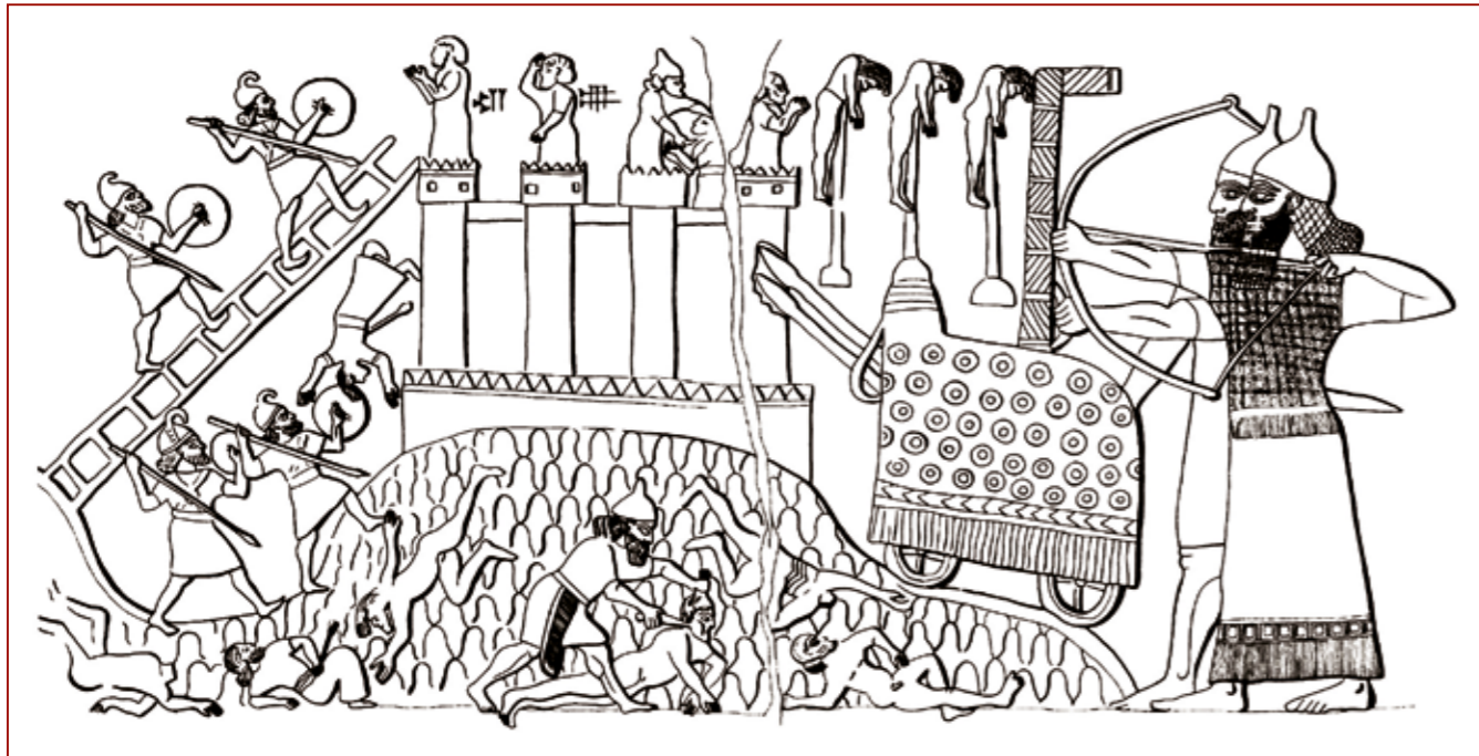
Belagerung einer Stadt – Relief aus dem Zentralpalast Tiglatpilesers III. in Nimrud/Irak