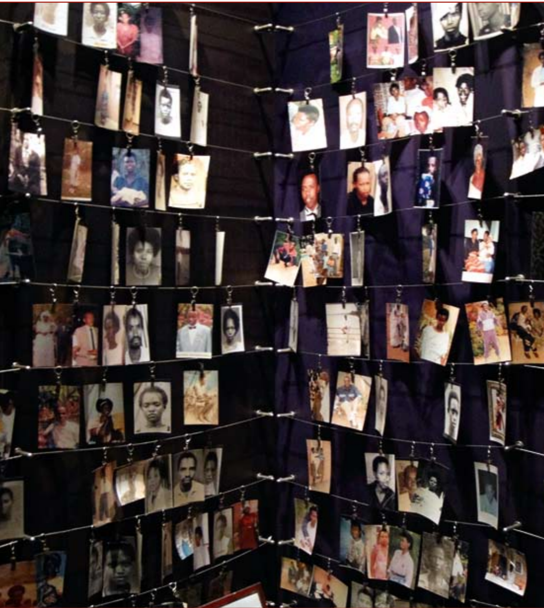
Fotos von Opfern in der Hauptgedenkstätte des Genozids von 1994 in Kigali/Ruanda

Das afrikanische Land Ruanda machte 1994 schockierende Schlagzeilen. Am 6. April wurde das Flugzeug des ruandischen Präsidenten Juvénal Habyarimana (zum Volk der Hutu gehörend) abgeschossen. Daraufhin begann ein barbarischer Völkermord: Die Hutu-Mehrheit war aufgehetzt, die Volksminderheit der Tutsi auszurotten. Innerhalb von drei Monaten wurden etwa 800.000 bis eine Million Tutsi und gemäßigte Hutus – Kinder, Frauen und Männer – auf grausame Weise ermordet.