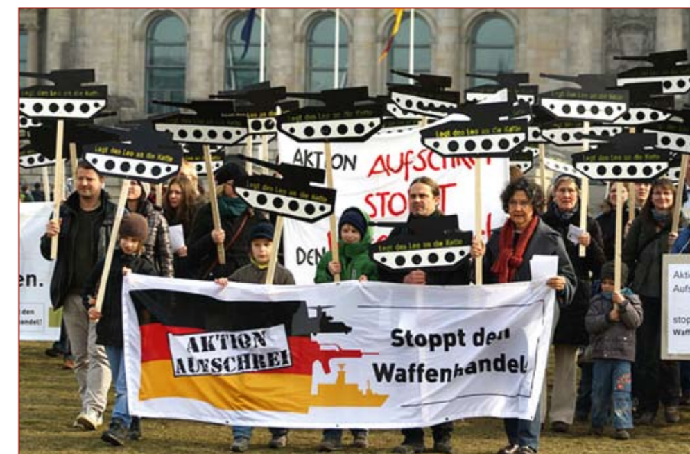
Friedenswache der Aktion Aufschrei – Stoppt den Waffenhandel!