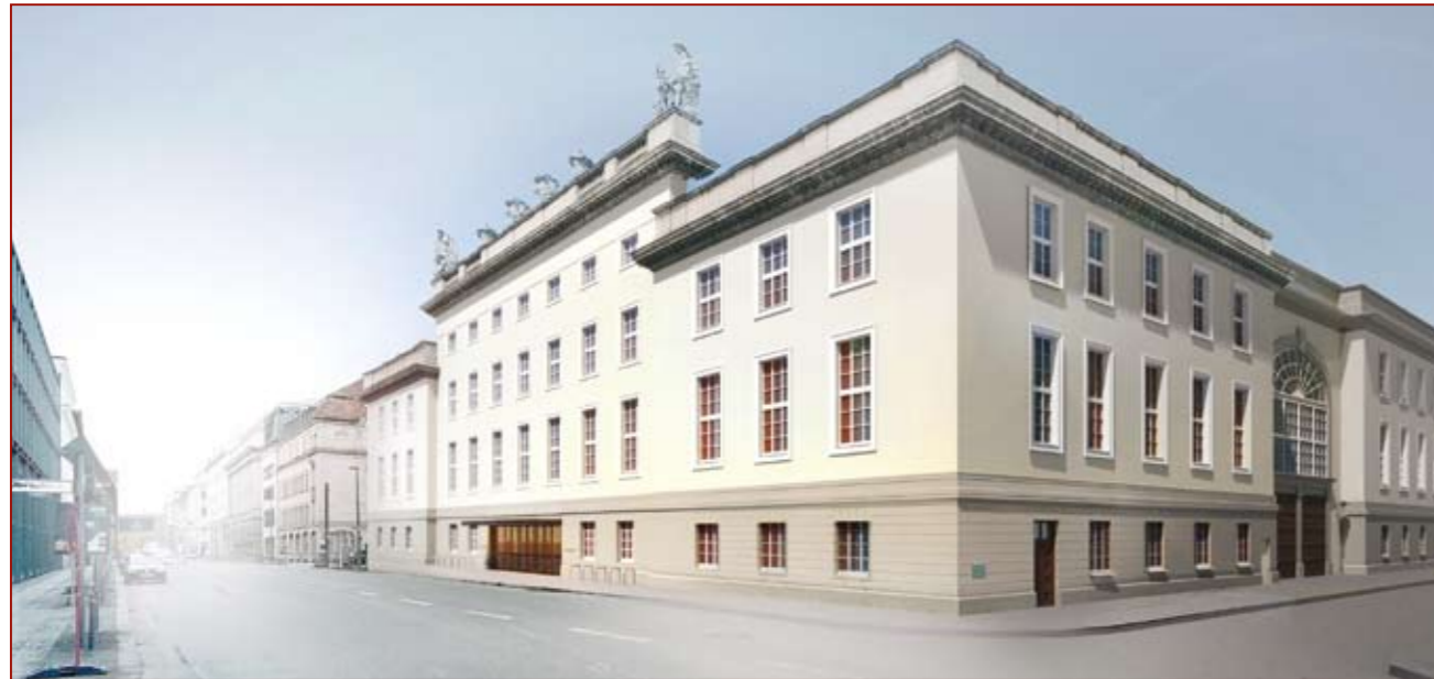
Das computersimulierte Bild zeigt, wie die Akademie nach Fertigstellung aussehen soll.